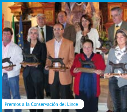
Premios a la Conservación del Lince