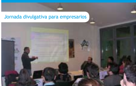
Jornada divulgativa para empresarios

Entrando ya en la recta final de este proyecto Life que finalizará en julio próximo, durante las últimas semanas de 2010 se han llevado a cabo los siguientes eventos divulgativos: