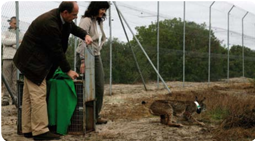
Liberación de uno de los lince para el reforzamiento de Doñana provisto de collar radio-trasmisor.

Cinco lince ibéricos fueron liberados el 4 de diciembre en los dos cercados de presuelta instalados en la zona de Guarrizas (Jaén). En uno de los cercados una pareja de adultos (Íbero y Eva) capturados en la Sierra de Andújar. En el segundo cercado se han liberado tres cachorros (Grazalema, Granadilla y Granizo) nacidos en 2010. Grazalema y Granadilla son los primeros cachorros nacidos en cautividad que se sueltan, por lo que se les hará un seguimiento de evaluación antes de decidir su liberación en el medio natural, mientras que Granizo fue capturado hace poco más de un mes en la zona de Cardeña (Córdoba).